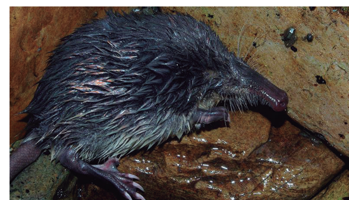
Toupa de río (Galemys pyrenaicus)