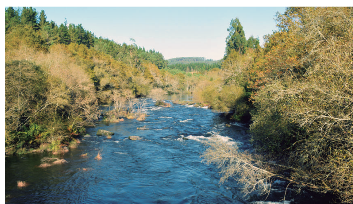
Vistas desde Ponte de Remesquide/ Vistas desde Ponte Remesquide

Este entorno resulta ideal como zona de recreo y pesca.