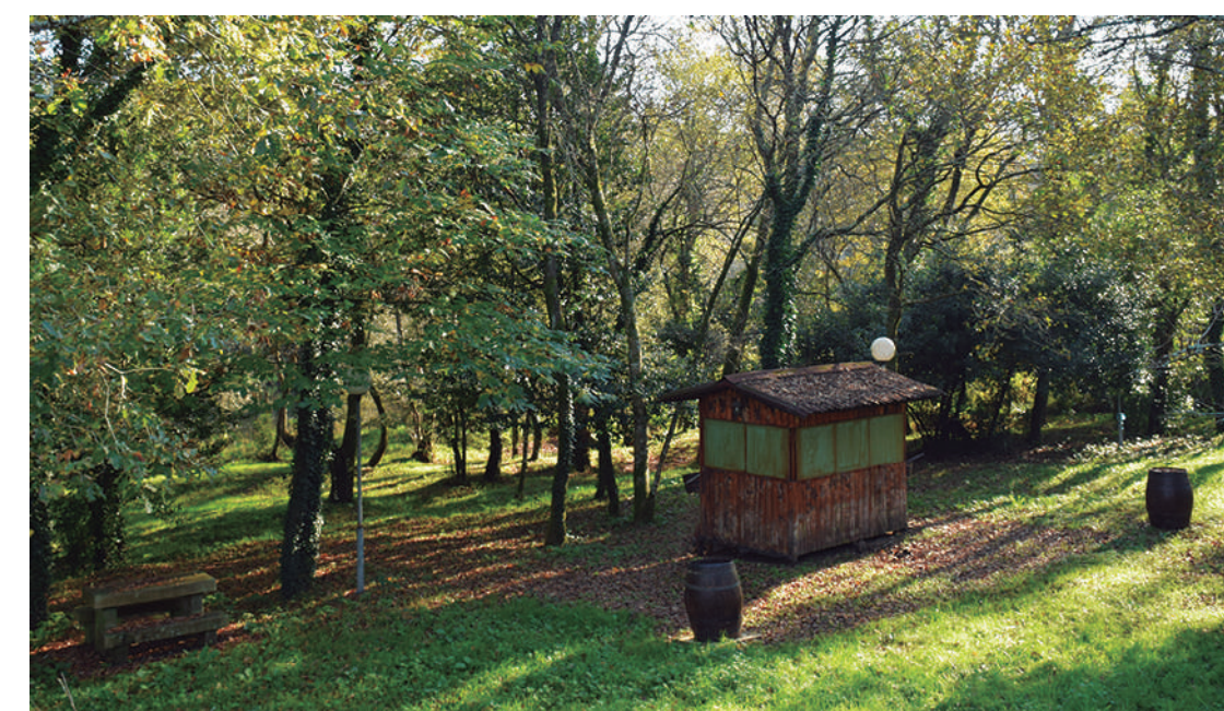
Área Recreativa de Remesquide