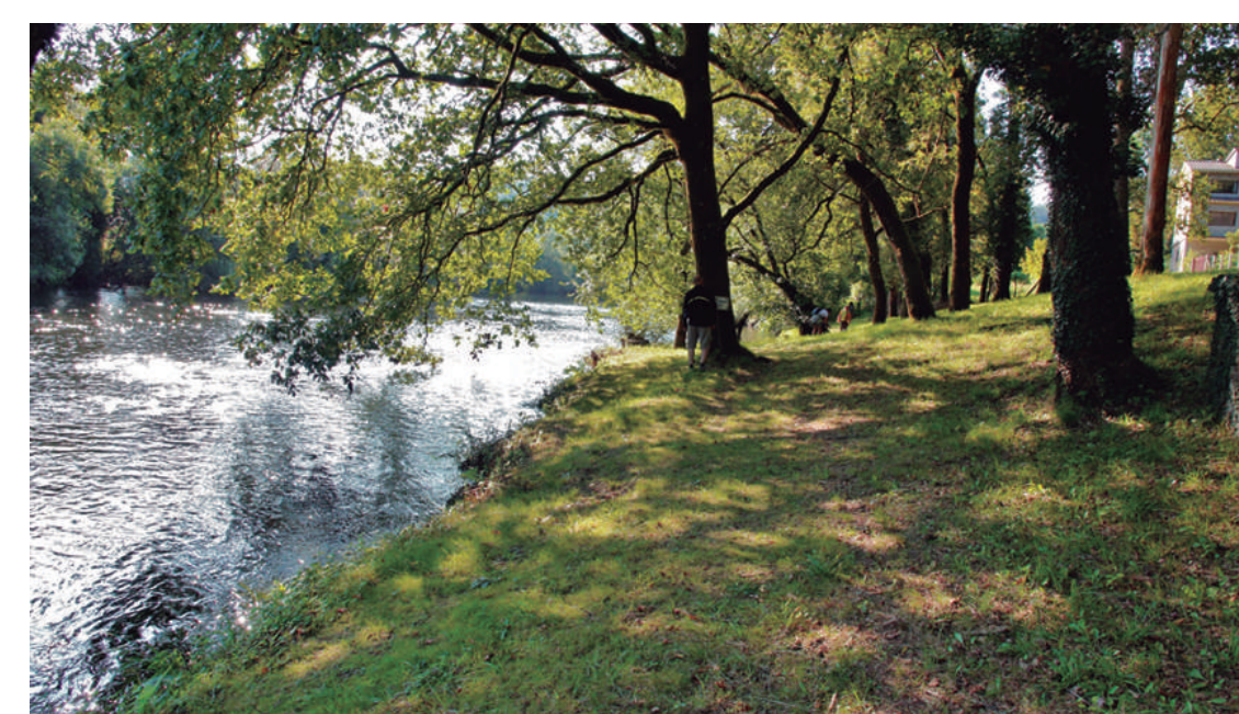
Área Recreativa de Souto do Barco