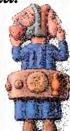
Enero Fin y principio