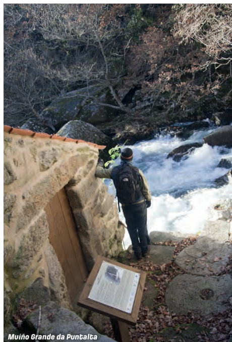
Muiño Grande da Puntalta