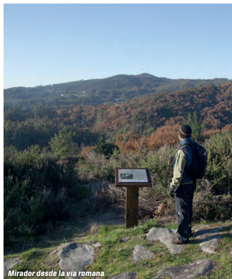
Mirador desde la vía romana