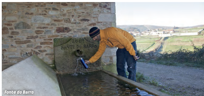
Fonte do Barro

El conjunto de fuentes y lavaderos, rehabilitados en su totalidad, dan sentido a esta ruta circular que invita al senderista a disfrutar de un típico paisaje de la Galicia rural en donde no faltan grandes prados verdes, casas de labranza y pequeñas explotaciones ganaderas.