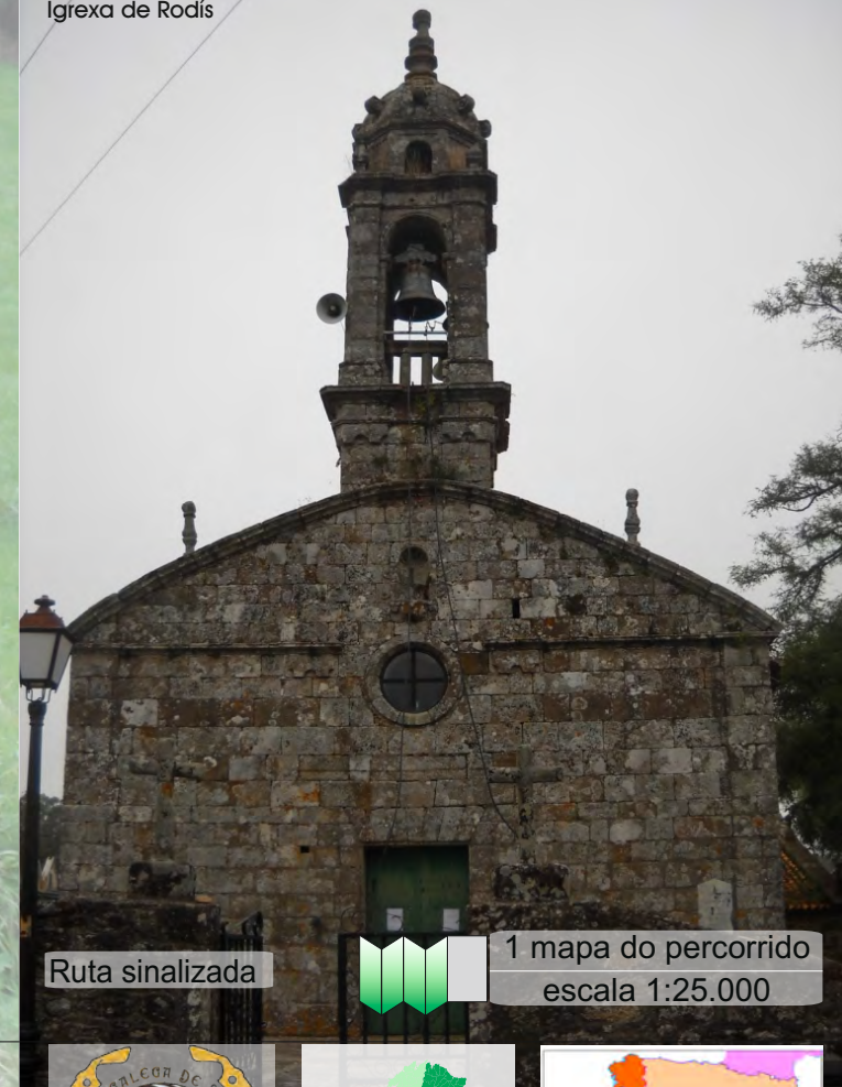
Igrexa de Rodís

A s paisaxes agrarias e forestais desta senda circular farannos gozar dunha fermosa natureza.