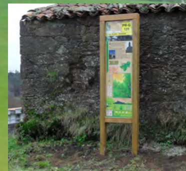
Igrexa de Xesteda