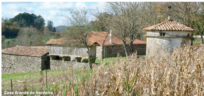
Casa Grande do Herdeiro

Estamos en otro de los senderos que conforman la red de rutas del municipio de Toques (PR- G 166, 167 y 168), entrelazados entre sí para que los recorridos puedan combinarse.