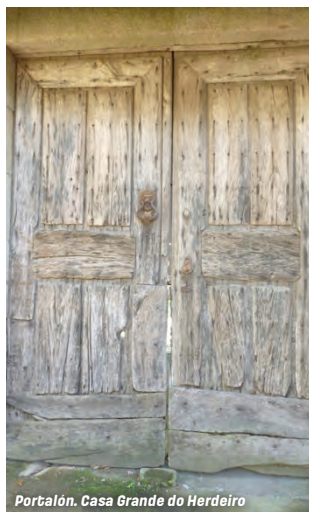
Portalón. Casa Grande do Herdeiro