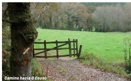
Camino hacia O Couso