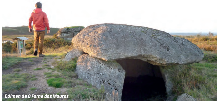
Dólmen de O Forno dos Mouros

Otra de las sendas de la red de rutas del municipio de Toques que tiene como principal atractivo O Forno dos Mouros, uno de los monumentos megalíticos más importantes de Galicia. El trazado es casi circular comenzando en la aldea de Mirallos y terminando a 900 m de este lugar. Realizando el recorrido en el sentido del reloj iremos hacia la Serra do Careón, recordando que nos encontramos en una zona catalogada como Lugar de Importancia Comunitaria (LIC).