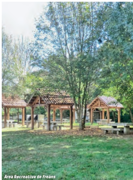
Área Recreativa de Freáns