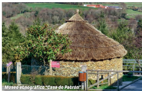
Museo etnográfico "Casa do Patrón"