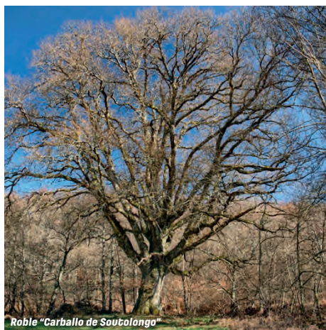
Roble "Carballo de Soutolongo"