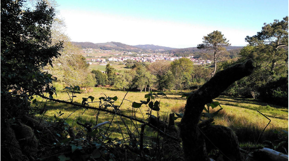
Vista do Val de Vimianzo dende Cubes.