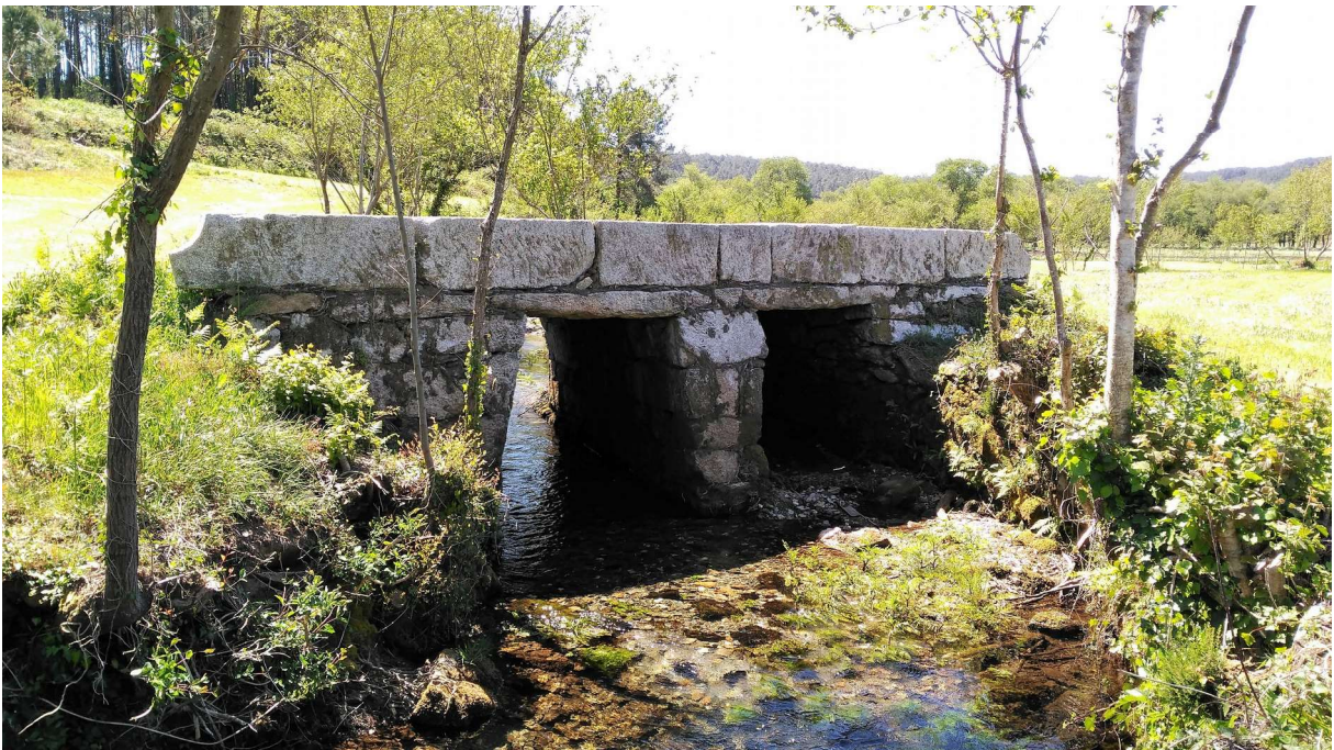
Ponte do Vao das Areas.