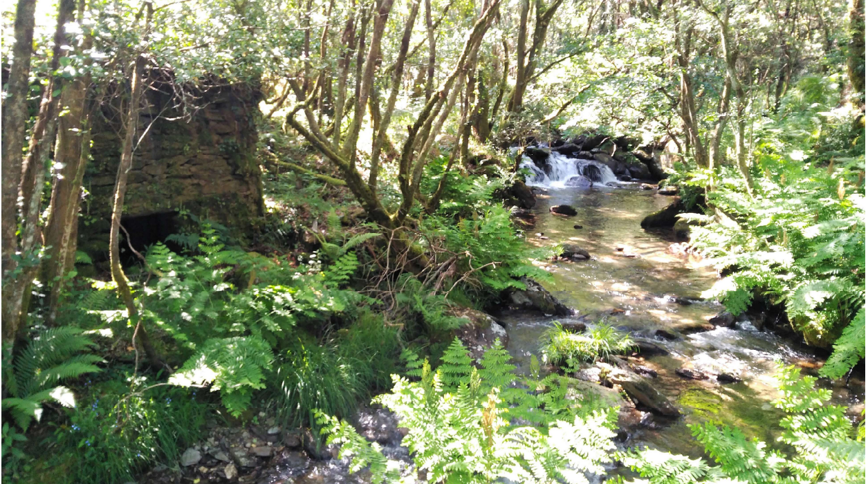
Un dos muíños que hai no Río Cambeda.